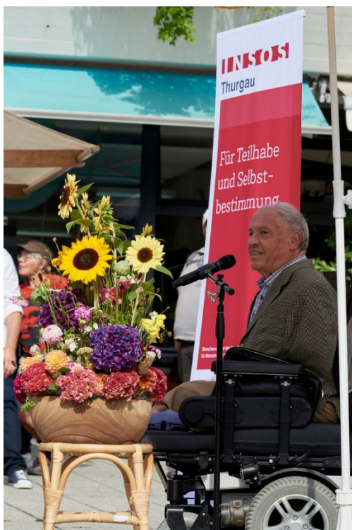
Nationalrat Christian Lohr als Gastreferent