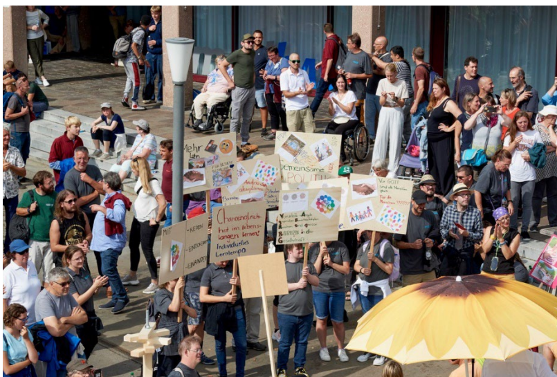
Teilnehmerinnen und Teilnehmer des Sternmarsches