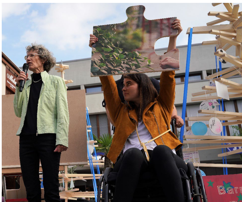
Geschäftsführerin Pro Infirmis Thurgau